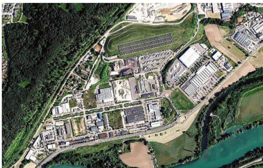
Blick auf den Gewerbepark Hochrhein an der B34 zwischen Waldshut und Tiengen.

Der Boden auf dem Areal war stark verunreinigt, unter anderem mit Quecksilber, und musste nach behördlichem Vorgaben von seinen Altlasten befreit werden. „Das hat Deutsche-Mark-Beträge im zweistelligen Millio-