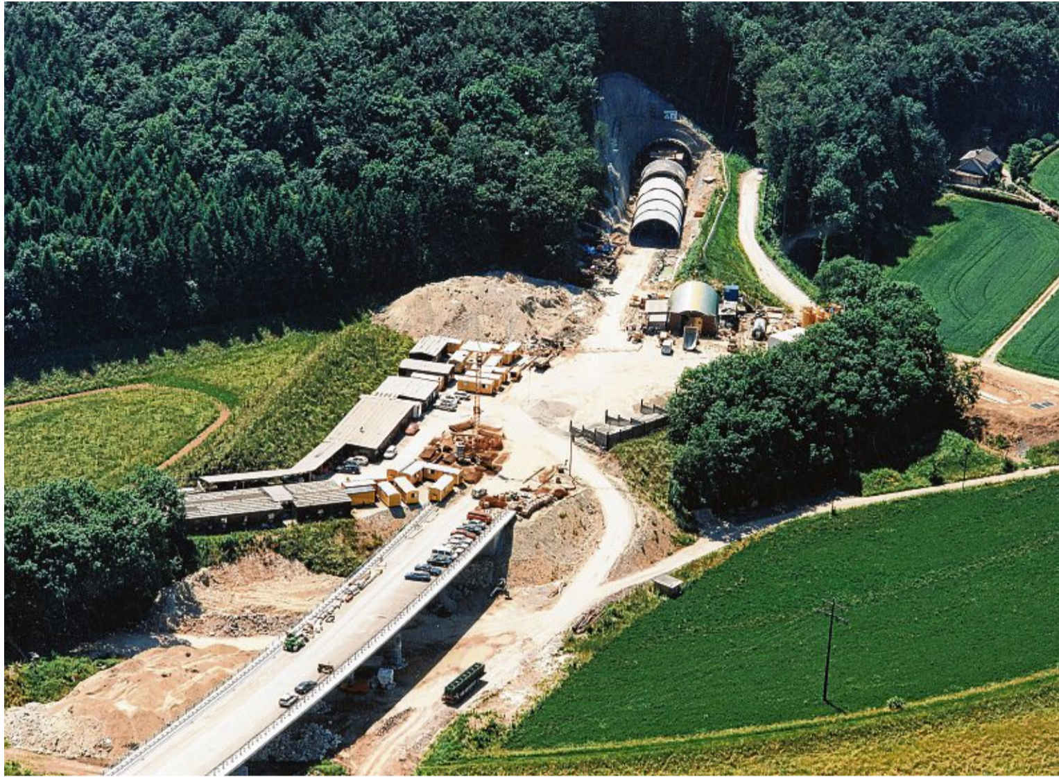
1997 eröffnet: Der Bürgerwaldtunnel ist die Ortsumfahrung von Tiengen und Lauchringen und wurde in gerade einmal vier Jahren fertiggestellt.

Apropos Sport: Große Visionen erfordern große Geldmittel. Das 1993