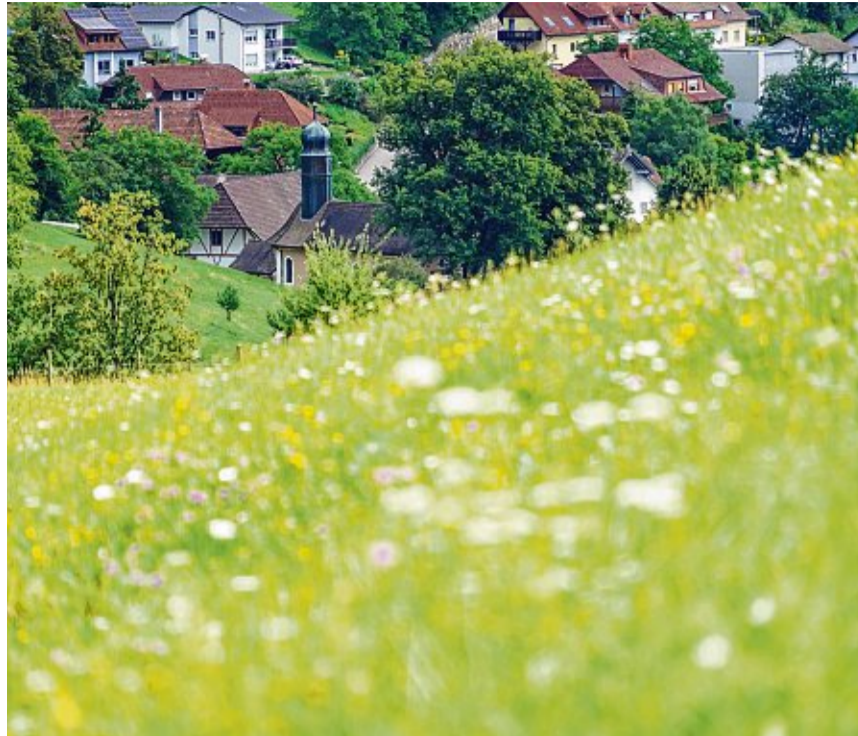
Von wilden Streuobstwiesen umgeben ist der zweitgrößte Ortsteil Eschbach ein Spaziergang wert. Im Herzen des Dorfes am Liederbach steht die Pankratius-Kapelle.

Das Herzstück Eschbachs ist das große Gemeindehaus, in dem sich neben dem Gemeindesaal die Mosterei, das Schlachthaus, die Feuerwehr, der Kindergarten und ein Kolping-