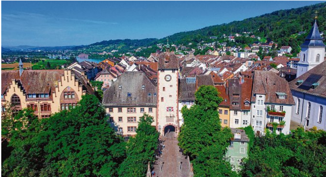
Blick aus der Vogelperspektive auf die Altstadt von Waldshut: Über die Seltenbachbrücke und das Obere Tor (Auch Schaffhauser Tor genannt) gelangt man in die mittelalterliche Kaiserstraße.