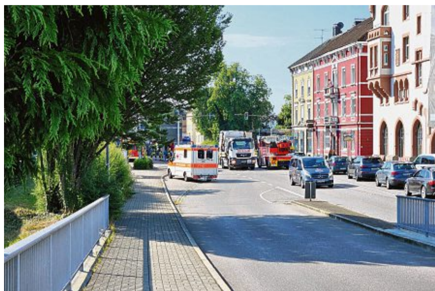
Links: Zwei Schulen, zwei Schulstraßen: Die Straße in Tiengen behielt ihren Namen. In Gurtweil wurde sie in Leo-Beringer-Straße umbenannt und erinnert an den Gurtweiler Dekan und Heimatforscher (1887 bis 1964). Rechts: Zwei Bahnhöfe, zwei Bahnhofstraßen: In Waldshut heißt sie jetzt Eisenbahnstraße, in Tiengen blieb es bei Bahnhofstraße.

Bereits vor der Gemeindereform hatte das Landratsamt Waldshut die Bürgermeister der Kreisgemeinden angeschrieben und erneut auf ein Problem aufmerksam gemacht, das die Krankentransporte beschäftigte. Mitunter gab es große Schwierigkeiten, den Wohnort eines Patienten schnellstmöglich zu finden. Empfohlen wurde dringend, auf eine deutlich sichtbare Straßenbezeichnung und vor allem lesbare Hausnummern zu achten. Lange vor der Zeit von Navis und Routenplanern bat das Deutsche Rote Kreuz darum, dass die Gemeinden ihm Ortpläne mit Straßennamen zukommen lassen sollten.