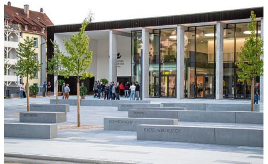
Die Sanierung der Stadthalle Waldshut samt Hallenbad und Sauna war ein Mammutprojekt in der jüngeren Zeit: 2018 wurde sie eröffnet.

Die Übergabe des Bürgerwaldtunnels war ein enormer Schritt für die Entlastung des Verkehrs auf der B34. Der in Rekordzeit von nur vier Jahren gebaute Tunnel war damals sogar der längste Autobahntunnel Deutschlands. Ein Grund für den damaligen