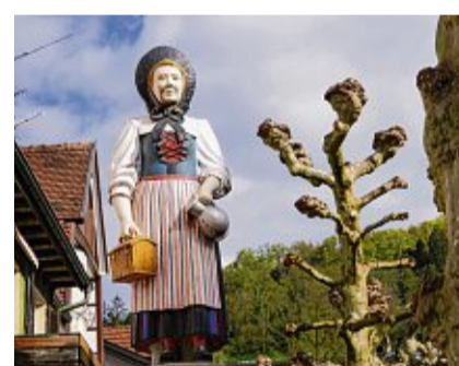
Auf dem Brunnen auf dem Marktplatz in Tiengen steht eine Dame in Klettgauer Tracht.