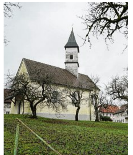
Die Johanneskapelle steht im Ortskern von Oberalpfen.

➤ Freizeit-Tipp: Wen Zahnschmerzen plagen, der ist der Sage nach in Oberalpfen richtig: Die Kapelle oberhalb von Oberalpfen ist der heiligen Apollonia gewidmet. Sie wird mit Zahn und Zange in der Hand dargestellt, weil sie als Schutzpatronin aller Zahnleidenden gilt. (Zwischen Albtalweg und Langholzweg). Unten im Dorf lockt nicht nur der Adler mit Hausmannskost. Dort steht auch die Kapelle St. Johannes, die um 1730 erbaut wurde und eine der ältesten im Stadtgebiet ist. (sl/sih)