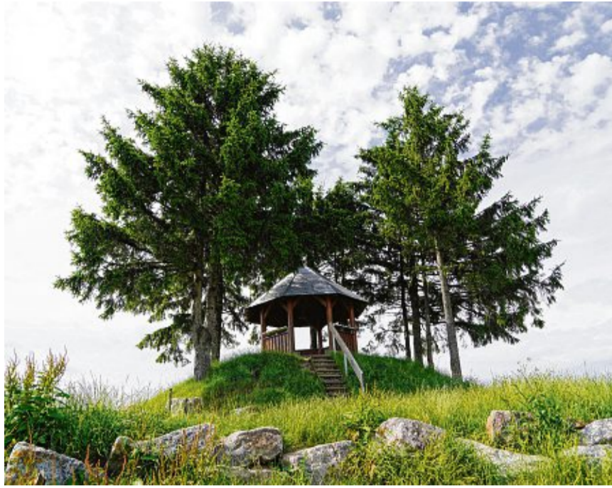
Auf dem Hungerberg, oberhalb von Indlekofen, lädt ein Pavillon zur Rast ein. Im Haselbachtal kann man über Brücken und Trampelpfade bis zum kleinen, aber idyllischen Haselbach-Wasserfall wandern und frische Luft tanken.

Ein landschaftlich ganz anderes Bild von Indlekofen bietet sich auf der gegenüberliegenden Seite des Haselbachs bei einer Wanderung über die weiten Felder und Wiesen hinauf auf den Hungerberg. Auf einer Höhe von 640 Metern steht auf einer kleinen Hochebene ein Pavillon, von dem sich eine außergewöhnliche 360-Grad-Rundumsicht eröffnet. Über zehn