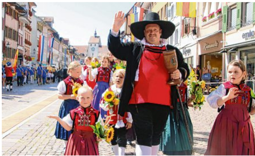
Zur Waldshuter Chilbi (links) führt das „Waldshuter Männle“ den Brauchtums-Nachwuchs von Alt-Waldshut beim großen Festumzug durch die Kaiserstraße.

Ausrichter ist die Bürger- und Narrenzunft Tiengen, mit Unterstützung der Stadt. Die Schwyzertagskommis-