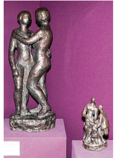
Skulpturen des Waldshuter Bildhauers Alfred Sachs (1907 bis 1990) während einer Ausstellung in der Artothek 2024.