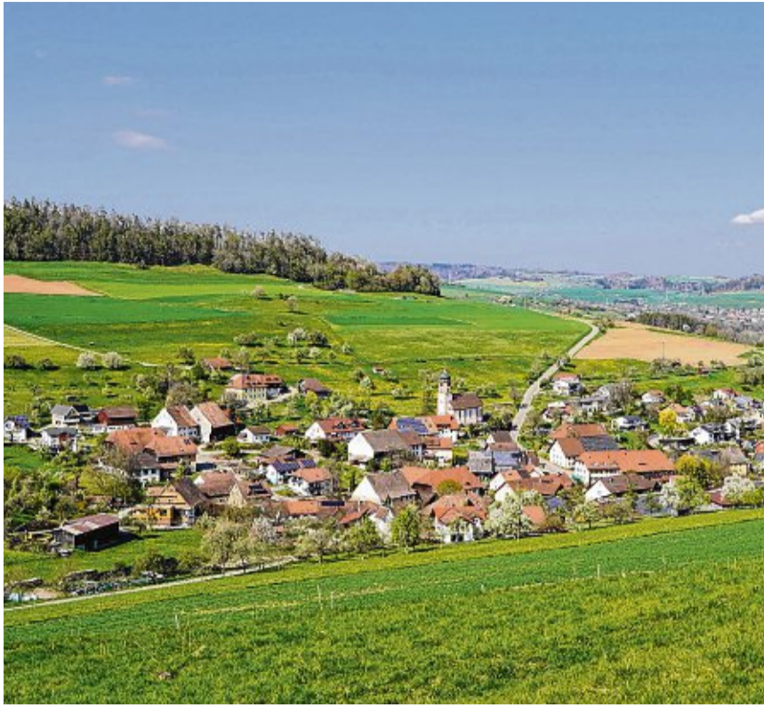
Krenkingen liegt am westlichen Steinatal inmitten von Feldern und Wiesen. In den vergangenen 50 Jahren sind die Einwohnerzahlen gestiegen.