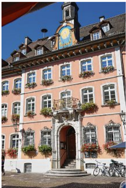
Das Rathaus in Waldshut von 1766 ist der Hauptsitz der Verwaltung der Doppelstadt.