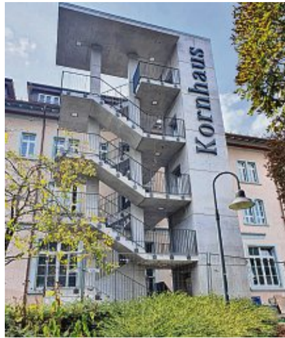
Das Kornhaus in Waldshut wurde umfangreich saniert und konnte 2023 barrierefrei und brandschutzkonform wiedereröffnet werden.