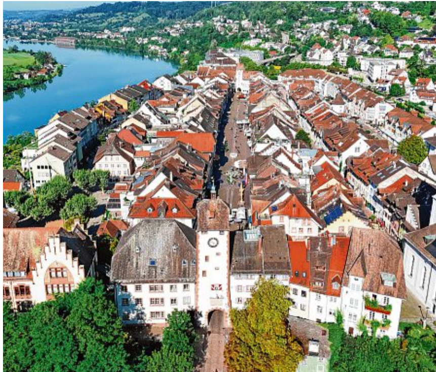
Die Waldshuter Kaiserstraße hat seit Einführung der Fußgängerzone eine florierende Außen-gastronomie und viel Platz für bunte Märkte.