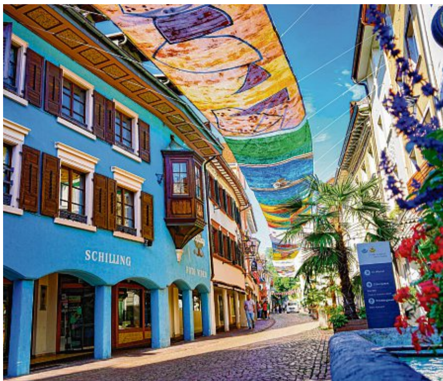
Tiengens Innenstadt bietet nicht nur viele inhabergeführten Geschäfte, sondern auch historischen Charme und Kunst, wie die Luftart im Sommer.

In Tiengen begann der Trend hin zur Grünen Wiese nach Aussage der Ak-