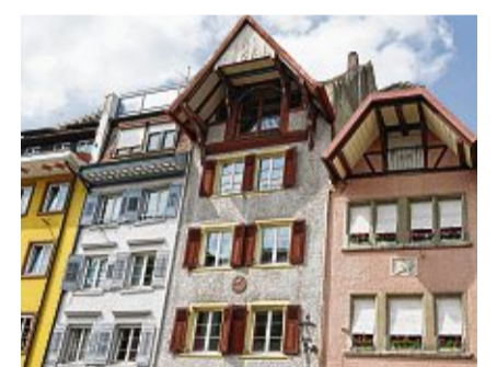
Die vielen mittelalterlichen Häuser machen die Altstadt in Waldshut ganz besonders.