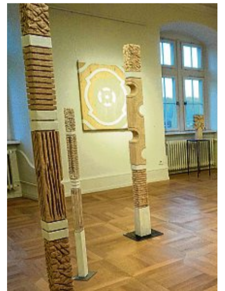
Reliefs und Skulpturen von Josef Briechle in den Schwarzenbergsälen im Schloss Tiengen während einer Ausstellung 2024.