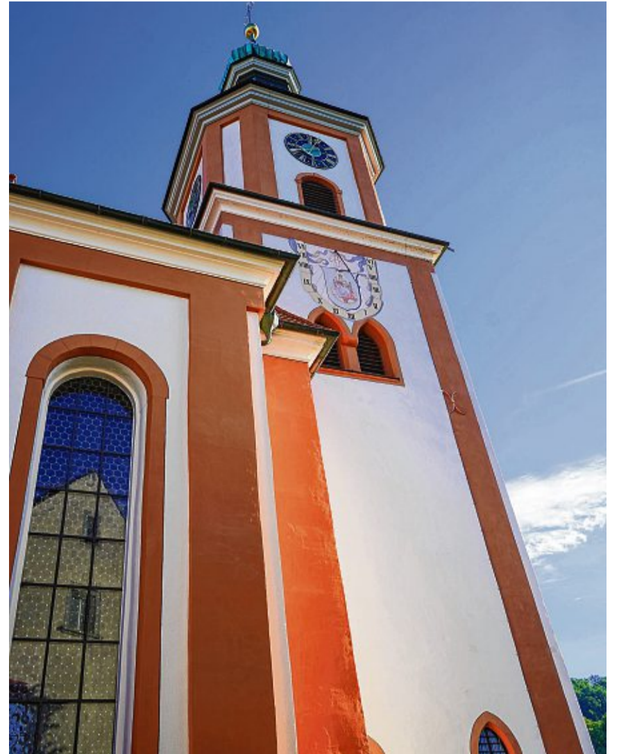
Die barocke Pfarrkirche Mariä Himmelfahrt in Tiengen wurde ab 1753 von Kirchenbaumeister Peter Thumb erbaut. Sie liegt auf einem Felsvorsprung über der Stadt.