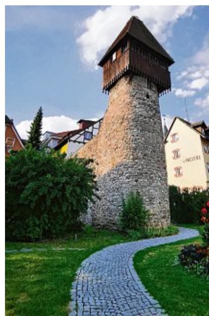
Der Storchenturm wurde etwa um 1300 erbaut und ist Tiengens Wahrzeichen.