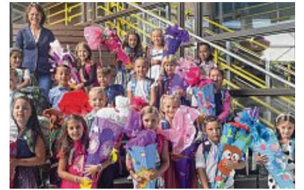
Schon die Kleinsten finden in der Schule in Gurtweil Platz.