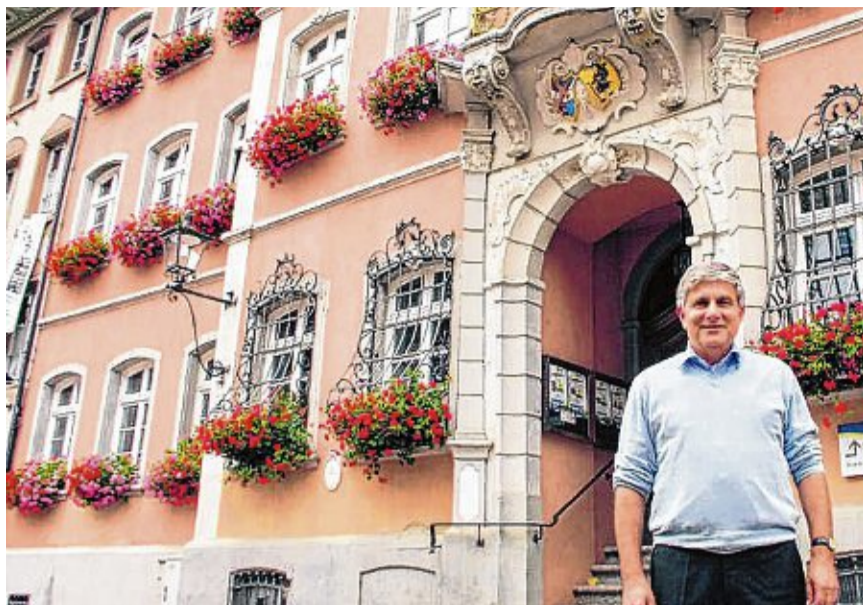
Von 1991 bis 2015 war Martin Albers Oberbürgermeister von Waldshut-Tiengen – mit 24 Jahren der längste Amtsinhaber bisher.

Wie kommt ein 33-jähriger Niedersachse auf den Stuhl eines Oberbürgermeisters im südbadischen Waldshut-Tiengen? Es waren wohl die Turbulenzen um die Gründung einer Doppelstadt, die den kommunalpolitischen Neuling ins Waldshuter Rathaus spülten. Als sich Franz-Joseph Dresen dem (an Köpfen) gewaltigen Übergangsgemeinderat vorstellte, ging es um die Rolle des „Amtsverwesers“, der die Zeit bis zur Volkswahl des Stadtoberhauptes überbrücken sollte. Diese erste Etappe verlief erstaunlich plangemäß, bedenkt man, dass im Gemeinderat, der nur in wenigen Sporthallen der neuen Kommune Platz fand, auch Parteifreunde saßen, die sich vor wenigen Wochen noch mit Flugblättern und in öffentlichen Reden bekämpft hatten. Der Mann von außen wurde mehr und mehr als neutraler Vermittler wahrgenommen. Dresen wuchs in die Rolle hinein und gewann Zustimmung auf allen Seiten. Die freundliche Distanz des Nord-