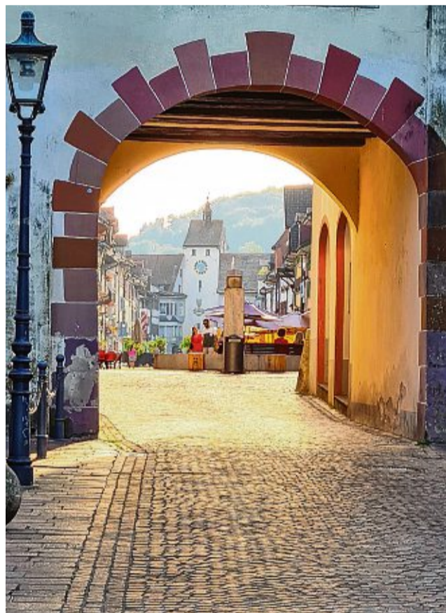
Aus zwei Städten und elf Dörfern mit langer Geschichte wurde 1975 die Doppelstadt Waldshut-Tiengen.