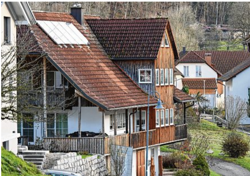
In der Waldkircher Straße sind in den letzten Jahren viele früher als landwirtschaftlich genutzte Gebäude zur zeitgemäßen Wohnnutzung umgebaut worden.