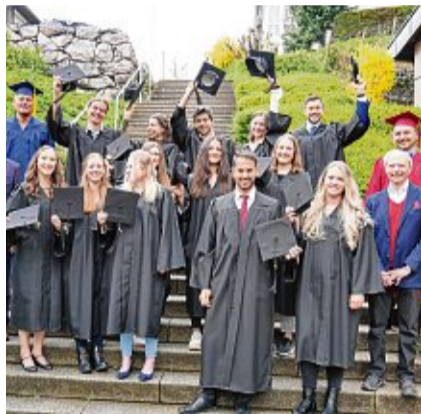
Stolze Absolventen: Diese Physiotherapeuten feiern ihren in Waldshut abgeschlossenen Bachelor-Titel.

der Qualifikationen. So können in Bad Säckingen die dualen Bachelorstudiengänge B. Sc. Physiotherapie und B. Sc. Ergotherapie angeboten werden. Dazu kommen zukünftig auch wissenschaftliche Weiterbildungen – etwa die