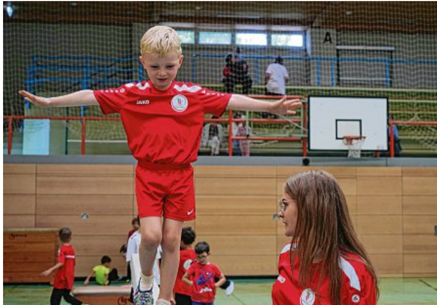
Vereine bieten Aktivitäten und Netzwerke für alle Altersklassen. In Waldshut-Tiengen gehören der Turnverein Tiengen (links) und Pro Freibad Waldshut zu den Gruppierungen mit den größten Mitgliederzahlen. Das ehrenamtliche Engagement der Mitglieder und Vorstände ist die tragende Säule des Vereins- und Alltagslebens.

Von allen registrierten Vereinen sind 76 in Waldshut daheim, 66 gestalten das Tiengener Alltags- und Festleben mit und 58 sind in den Ortsteilen