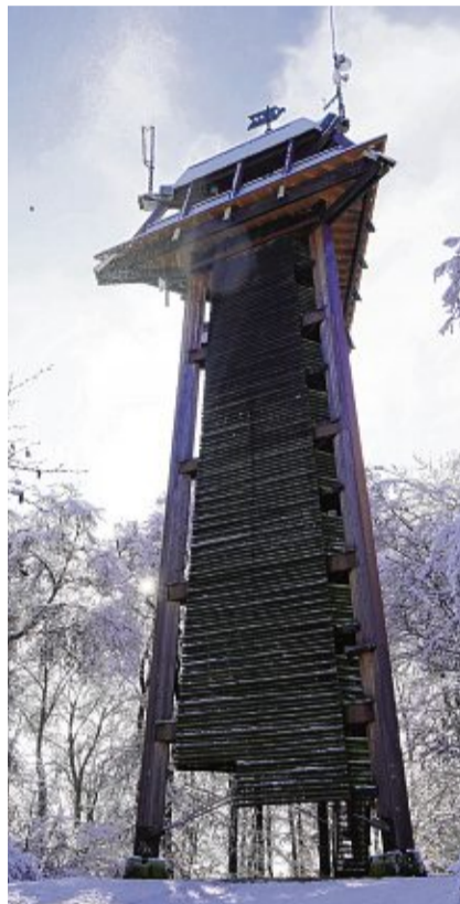
Der alte Vitibuck-Turm brannte 1975 ab, der neue glänzt im Schnee.