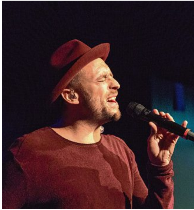
2018 wurde die neue Waldshuter Stadthalle eröffnet – zu diesem Anlass weihte der aus Krenkingen stammende Max Mutzke die Bühne ein.

Die Stadthalle in Waldshut dient oft als Ort für große Konzerte. Nicht nur wegen ihrer Größe, sondern weil dort auch ein Klavier steht, wie die Kultur-