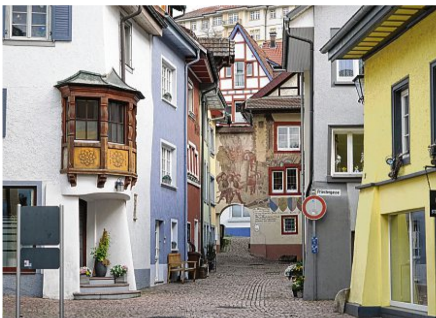
Das Haus Schnitzer in der Zubergasse in Tiengen ist mit seinem Rundbogendurchgang und den Wandgemälden ein Blickfang. Im Keller befand sich einst ein jüdisches Frauenbad.