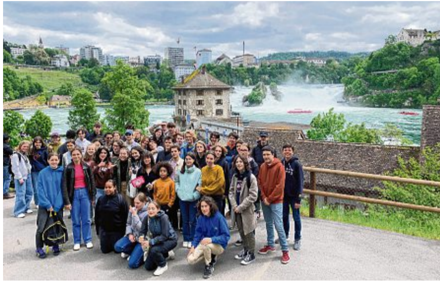
Französische Gäste aus Blois sind auch immer wieder in Waldshut zu Besuch. Ein Tagesauftrag an den Rheinfall gehört für die meisten zum Programm in der Region zwischen Hochrhein, Schweiz und Südschwarzwald.

Zu Ostern und im Sommer waren die festen Termine für den Schüleraustausch zwischen Blois und Waldshut. „Drei Wochen lang hielten sich die