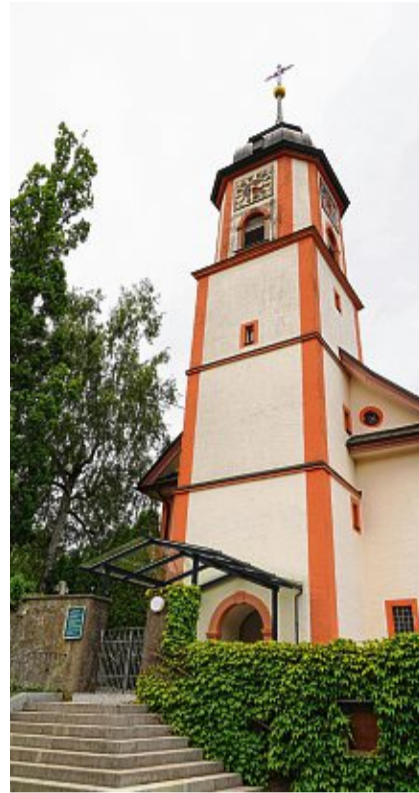
Die Sankt Nikolauskirche in Krenkingen wurde 1766 errichtet.