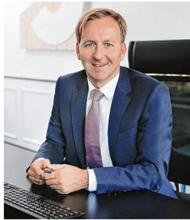
Erst 2023 das Amt übergeben hat Philipp Frank. Er war von 2015 bis 2023 Oberbürgermeister der Großen Kreisstadt.