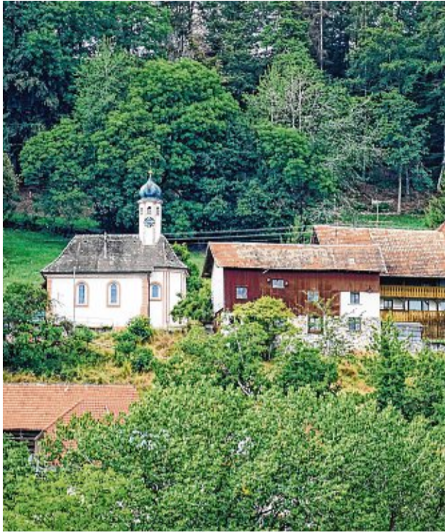
In Gaiß (links) steht die St. Michael Kapelle, in Waldkirch die große Pfarrkirche Maria Himmelfahrt. Beide Dörfer des Ortsteiles sind von üppigen Wäldern und grünen Wiesen umgeben.

Basler sagt in einem Gespräch: „In den letzten 20 Jahren ist Gaiß-Waldkirch gewachsen und aktuell haben wir 261 Einwohner.“ Dabei sei die Zusammensetzung der Bevölkerung mit über 40 Kindern unter 14 Jahren sehr jung. Einen Kindergarten oder eine Schule gibt es allerdings nicht.