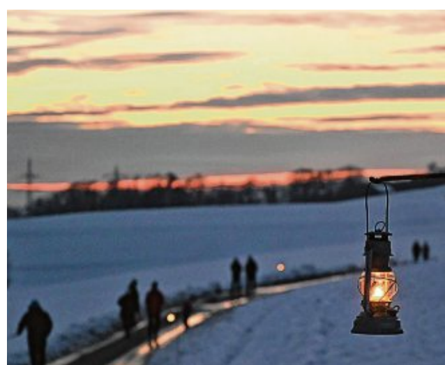
Die Mostfreunde Eschbach gestalten jeden Dezember an den Adventssonntagen einen 2,2 Kilometer langen Rundweg mit 65 Laternen auf dem Haspel.