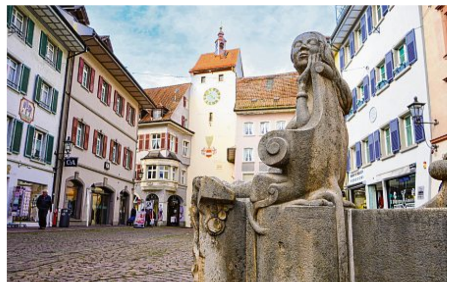
Nur bei genauerer Betrachtung zu erkennen: Das Untere Tor (Basler Tor) in Waldshut ist viel niedriger und älter als das Obere Tor.