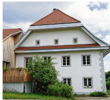
Das Schlössle (Waldkircher Str. 18) ist heute ein Privatwohnhaus, blickt aber auf eine lange Geschichte zurück.

➤ Freizeit-Tipp: Das Schlössle (Waldkircher Straße 18) ist das geschichtsträchtigste Gebäude: Um 1780 erbaut als Landsitz des Freiherrn von Roll, wurde es 1786 erst Brauerei, dann zudem Gasthaus. 1835 hieß es „Zum rothen Löwen“. Erwandern kann man das Schmitzinger Tal und die umliegende Hügellandschaft: Oberhalb des Ortes lockt der Aussichtspunkt Pfannenstiel.