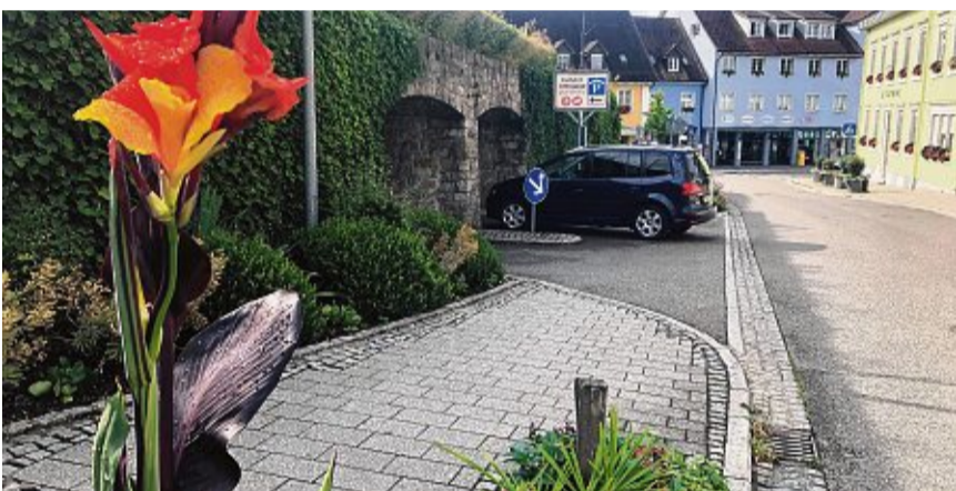
Weil die Hauptstraße in Tiengen zur Fußgängerzone wurde, schaffte man mit der Schlossgarage neue Parkmöglichkeiten – und den Schlossgarten als nette Beigabe.