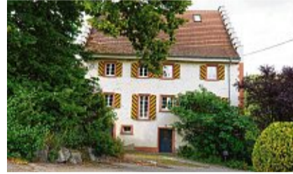
Die Vogtei ist eines der schönsten und ältesten Gebäude von Detzeln.

Ziele für die Zukunft von Detzeln: „Dass das Dorf weiter wächst, vor allem auch durch junge Leute“, sagt sie, „ich wünsche mir außerdem, dass der alte Dorfkern vor der Steina und das Neubaugebiet hinter der Steina weiter zusammenwachsen“.