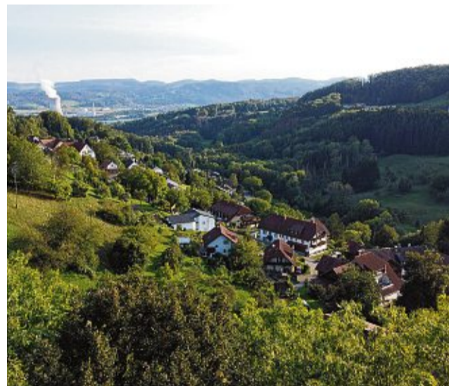
Eschbach liegt im Liederbachtal und bietet an klaren Tagen Sicht bis auf die Schweizer Alpen.

Landratsamt Waldshut, Eigenbetrieb Abfallwirtschaft Waldtorstr. 1, 79761 Waldshut-Tiengen Telefon 07751 / 86-5440, Telefax 07751 / 86-5499 abfallwirtschaft@landkreis-waldshut.de, www.abfall-landkreis-waldshut.de