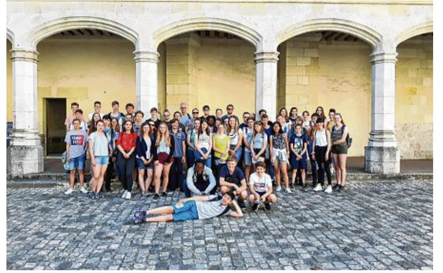
Lange Zeit dauerte der Schüleraustausch zwischen Blois und Waldshut noch drei Wochen. Heute sind es nur noch wenige Tage. Im Bild die Konzertreise der Bläserphilharmonie Südschwarzwald am Klettgau-Gymnasium.