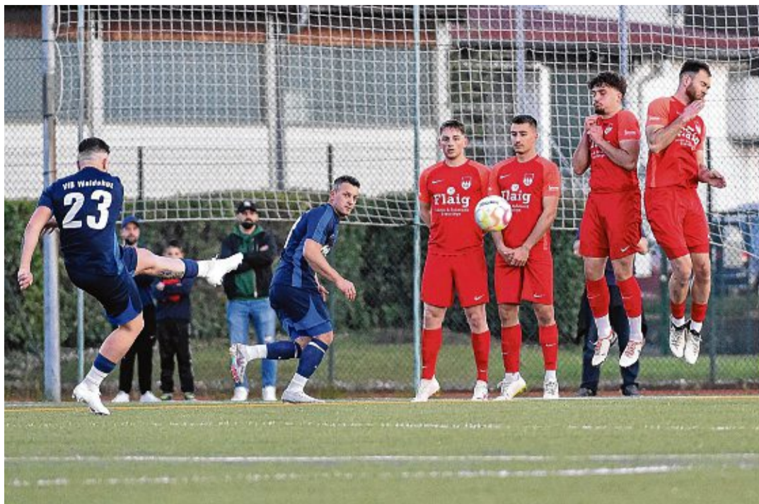
Das letzte Derby – FC Tiengen 08 in Blau, VfB Waldshut in Rot – fand im September 2023 statt. Schon in den 1950er-Jahren waren Zusammentreffen der beiden Mannschaften echte Publikumsmagneten, die die Vereinskassen mit satten Eintrittsgeldern füllten und für ausgelassene Stimmung sorgten.

Das war im September 2023. Auch in früheren Zeiten waren die Stadtderbys Publikumsmagneten. Aktuell sind solche Derbys gar nicht mehr möglich, weil der VfB Waldshut nach dem Abstieg im Sommer nicht mehr in derselben Liga wie der FC Tiengen 08 spielt.