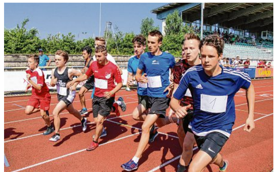
1993 wurde das Langensteinstadion in Tiengen eingeweiht und bietet nicht nur Platz für Fußball, sondern auch für Leichtathletik und Schulsport.