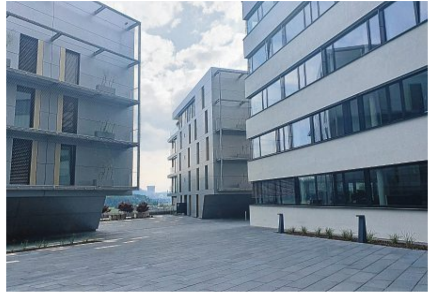
Der Campus der Fachhochschule des Mittelstands befindet sich in Waldshut in der Bismarckstraße zwischen Sparkasse und Justizvollzugsanstalt.