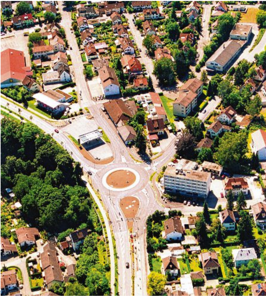
2009 ging der Mowag-Kreisverkehr in Tiengen in Betrieb, um den Verkehr zu beruhigen und das Unfallrisiko zu senken.