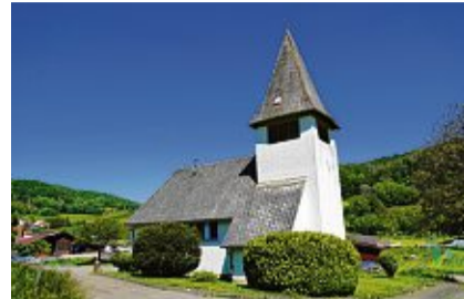
Die Maria-Königinnen-Kirche wurde von den Bürgern selbst gebaut.