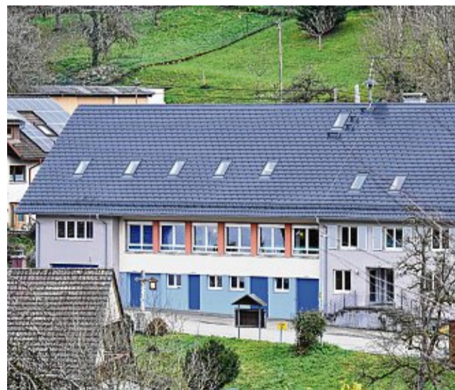
Das Eschbacher Gemeindehaus mit Gemeindesaal, Kindergarten, Mosterei und Schlachtraum ist das Herzstück des Dorfes.