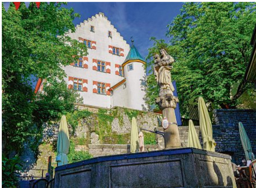
Das Schloss thront über der Tiengener Altstadt. Über mit Efeu umrankte Treppen und Mäuerchen kann man sich durch die urigen Gassen treiben lassen und historische Luft schnuppern.