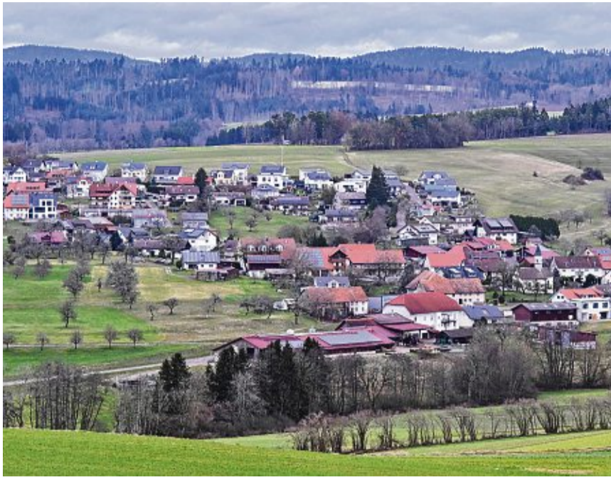
Oberalpfen liegt am Leiterbach. Der nord-westliche Ortsteil von Waldshut-Tiengen hat 440 Einwohner.

Das zum Hochrhein hin geöffnete Tal, in dem sich Oberalpfen befindet, wurde in der frühen Besiedlungszeit auch Pforte zum Wald genannt. Heute gibt es noch 19 Hektar Gemeindefeld und zusätzlich 186 Hektar Privatwald. Früher ging der Wald noch bis an die Besiedlung, während die Ortschaft heute mehr von Feldern und Wiesen umgeben ist. Das Dorf, zu dem auch eine ehemalige Mühle und ein Sägehaus gehören, hat auch nach dem Zusammenschluss seinen dörflichen Charakter bewahrt. Je-