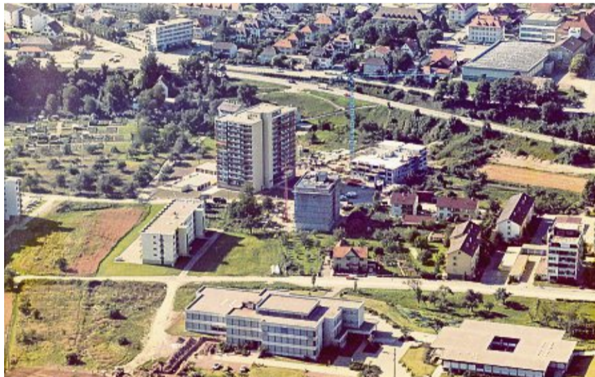
1973 wurde das einzige Hochhaus der Stadt fertiggestellt. Das Gebäude in der Tiengener Pommernstraße ist 36 Meter hoch und aus der Ferne zu sehen.