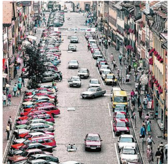
1987: Die Kaiserstraße kurz vor Einführung der Fußgängerzone 1989.