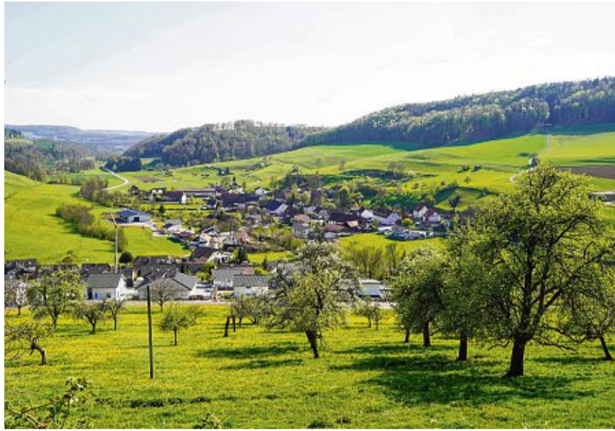
Detzeln hieß früher Tezzilnheim und ist offiziell der älteste Ortsteil der großen Kreisstadt Waldshut-Tiengen.

Detzeln ist seither gewachsen und heute zählt der am unteren Steinatal gelegene Ort mit dem Weiler Tierberg 314 Einwohner. Die Struktur im Dorf hat sich in den vergangenen fünf Jahrzehnten stark verändert. In den 1970er-Jahren gab es noch über 100 Erwerbstätige in der Land- und Forstwirtschaft. Da es früher einmal viele Landwirte gegeben hat, gab es auch eine Straßenwaage im Dorf, auf der die Ladungen mit Getreide oder Heu und