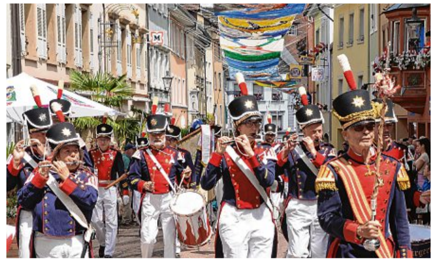
Bürgerwehr und Spielmannszug der Bürgerzunft 1503 Tiengen richten den Schwyzertag mit aus und unterhalten beim Umzug auch selbst auf musikalische Weise.