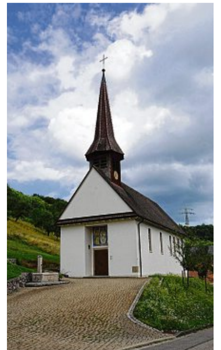
Die Kapelle St. Joseph in Schmitzingen ist dem Schutzheiligen der Handwerker gewidmet.