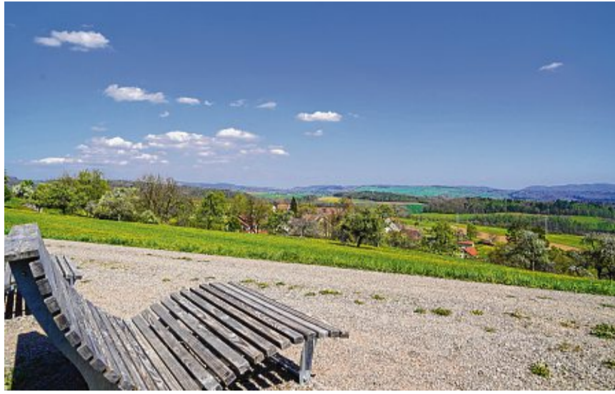
Auf Himmelsliegen kann man den Blick über Breitenfeld schweifen lassen. Rund 80 Pferde gibt es in dem Dorf.

Der Dorfplatz am Brunnen und Rathaus wirkt heimelig. Hier trifft man sich zum Dorfrock, zu Vorträgen oder zum Apfelsaftpressen. Zur jährlichen Serenade der Stadtmusik Tiengen wird